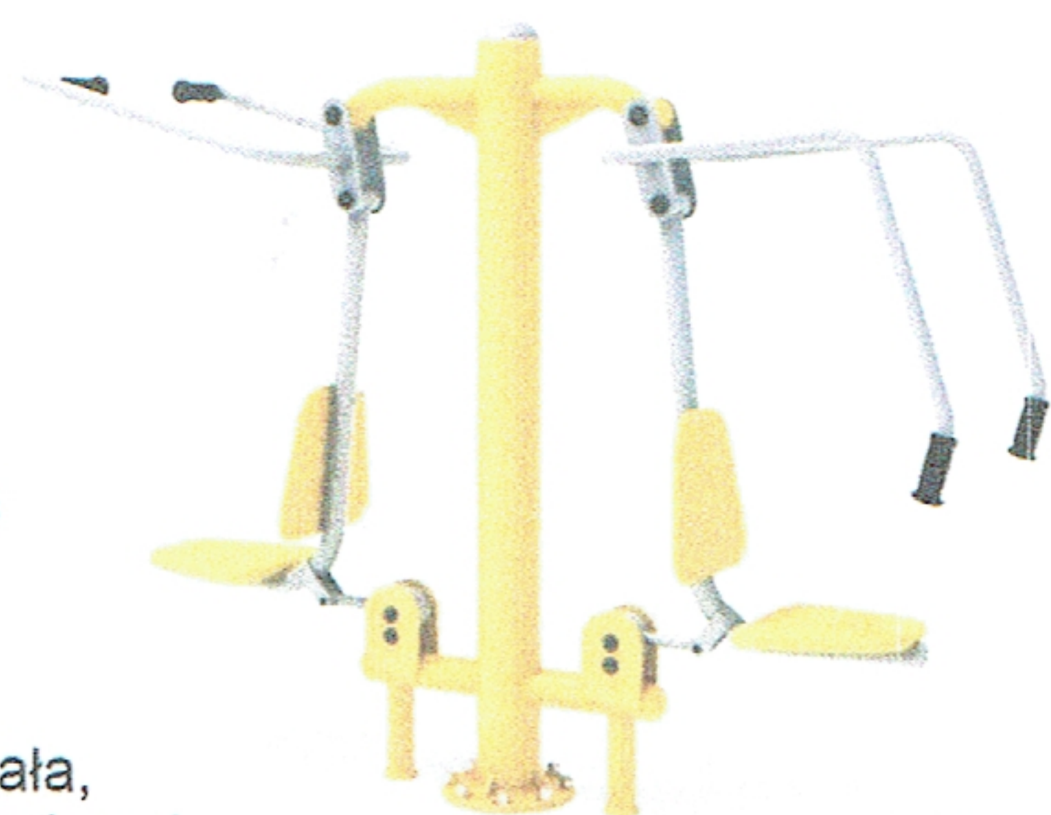
Przykładowa wizualizacja urządzenia.